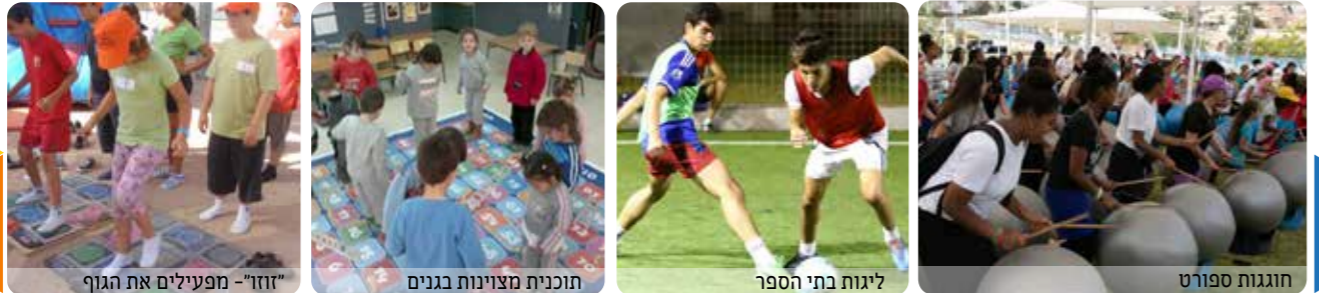
זוזו - מפעילים את הגוף | תוכנית מצוינות בגנים | ליגות בתי הספר | חוגגות ספורט