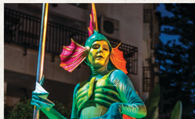
מיצג תאטרלי מעולם הים