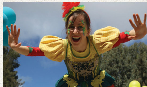
צמד חמד אקרובטיקה